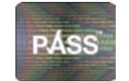
Logo Hologram PASS PASS Hologram Logo

Er mwyn helpu, bydd yr Adran Iechyd yn atgoffa pobl - yn enwedig rhai yn eu harddegau - drwy ymgyrch gyfathrebu, o'r angen i gario prawf oedran o gynllun PASS achrededig.