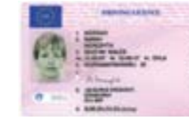
Trwydded Yrru â llun Photo Driving Licence