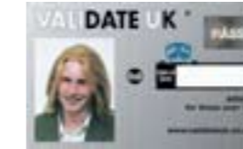
Cerdyn Validate Validate Card