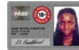
Cerdyn 'Prove It' Portman Portman 'Prove it' Card